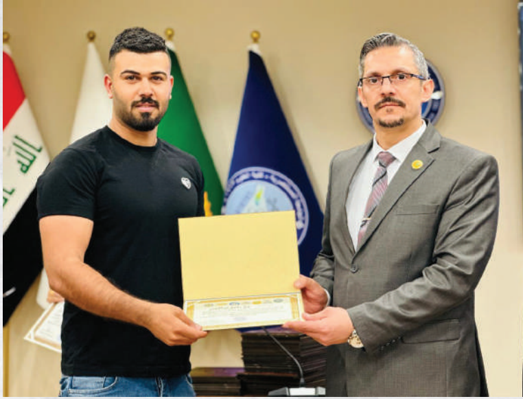
الدورة التدريبية الدولية ادارة مشاركة الفرق الطلابية في المهرجانات الجامعية