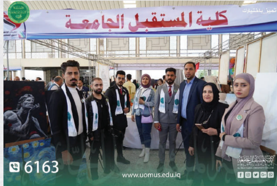
المهرجان الجامعي للفنون التشكيلية للطلاب والطالبات