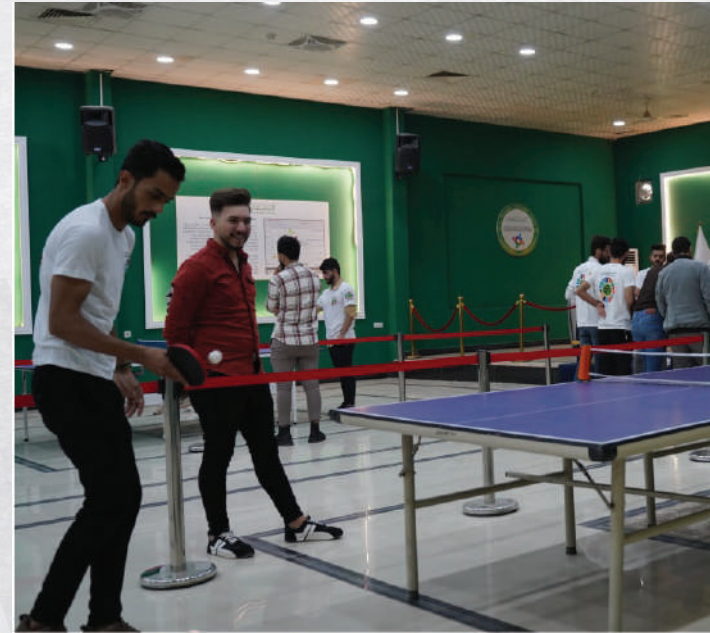
بطولة تنس الطاولة