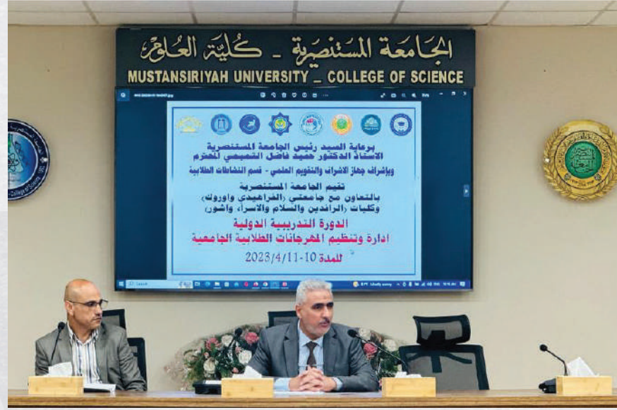
الدورة التدريبية الدولية ادارة وتنظيم المهرجانات الطلابية الجامعية