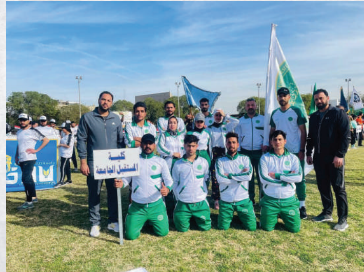
بطولة العاب القوى