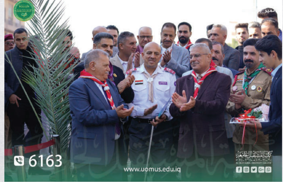
دورة اعداد مسؤولي الجواله ومسؤولات والدليلات