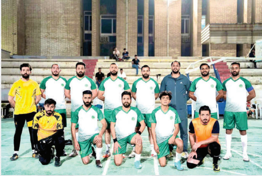
بطولة المستنصرية المفتوحة الاولى بكرة القدم الصالات