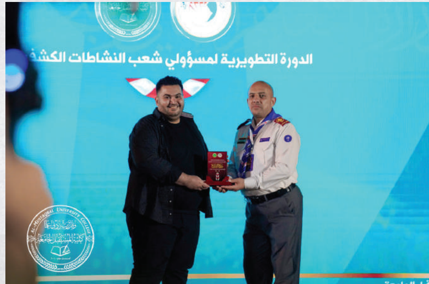
الدورة التطويرية لشعب النشاطات الكشفية